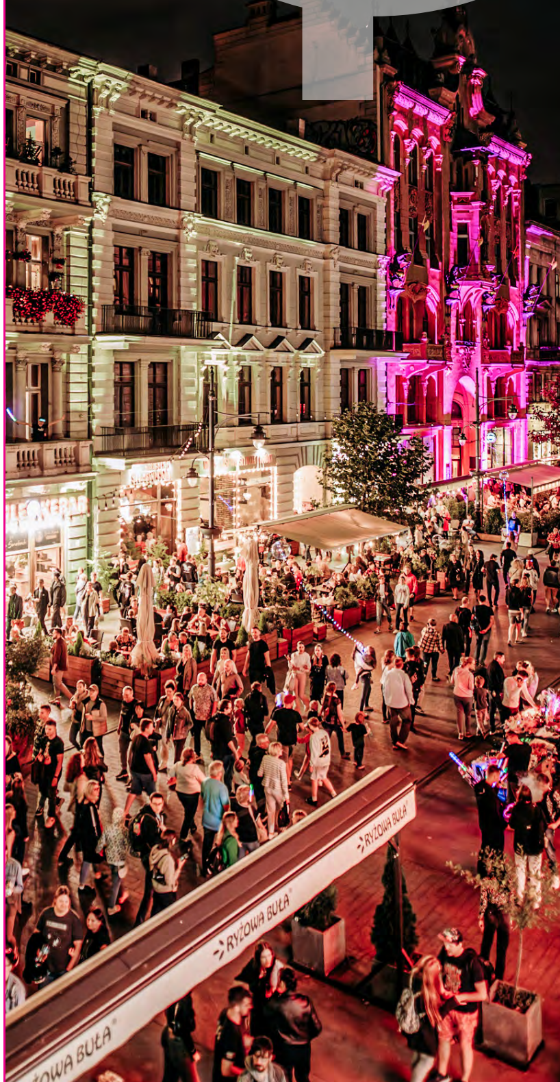
LIGHT . MOVE . FESTIVAL

Cele strategiczne Polityki rozwoju kultury dla miasta Łodzi 2030+ wpisują się bezpośrednio w trzy obszary tematyczne wyodrębnione dla Celu strategicznego III: Łódź odpowiadająca na oczekiwania interesariuszy, tj. Miasto twórcze, Miasto wartościowego wypożyczenia, Łódź liderem sektora audiowizualnego oraz Celu strategicznego I: Łódź silna i odporna – obszar tematyczny Miasto jakościowej edukacji .