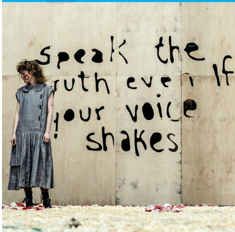
TEATR NOWY IM. KAZIMIERZA DEJMKA W ŁODZI