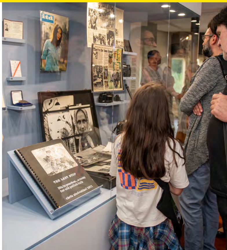
WYSTAWA W MUZEUM MIASTA ŁODZI

W przyjętej Strategii Rozwoju Miasta Łodzi 2030+ określono także kierunki prowadzenia rozwoju Miasta, odzwierciedleniem przyjętych w strategii celów jest lista strategicznych przedsięwzięć. Zadania związane z Polityką Rozwoju Kultury uwzględnione