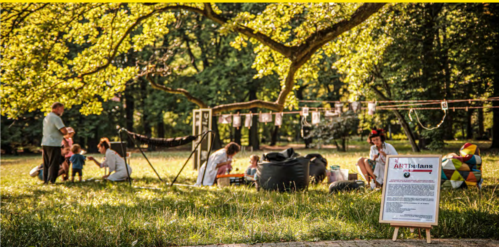
ARTBULANS - ARTYSTYCZNA STREFA INTENSYWNEJ TERAPII, FUNDACJA PRZĘDZALNIA SZTUKI

szczość z nich nie posiada umiejętności sporządzania aplikacji pozwalających na realizację projektów finansowanych ze środków UE. Za największe zagrożenie dla swojej działalności instytucje uznają pogarszającą się sytuację gospodarczą w kraju, wysoką inflację i wzrost cen energii i surowców wykorzystywanych w działalności. Zjawisko to wiąże się także ze zubożeniem społeczeństwa i związanym z tym spadkiem popytu na kulturę. Instytucje wskazują także na postępujące zmiany preferencji odbiorców kultury, słusznie wskazując, że bez powszechnej edukacji kulturalnej kultura wysoka będzie przegrywać w konfrontacji z innymi formami kultury. Równie często wskazywanym zagrożeniem są także negatywne trendy demo-