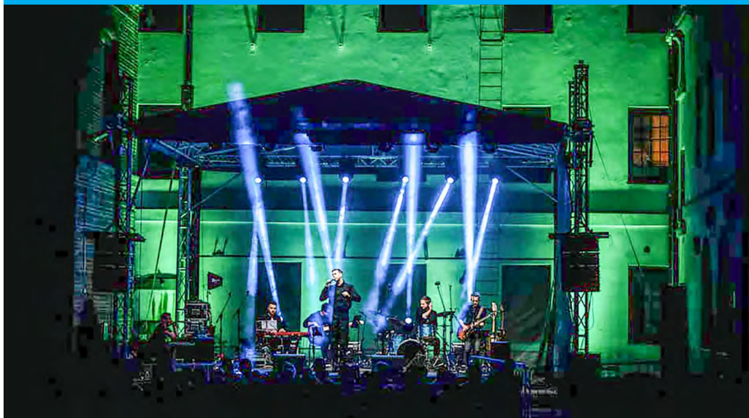
GEYER MUSIC FACTORY 2023 „FILMOWE PARTYTURY”, FUNDACJA MOZART I TY