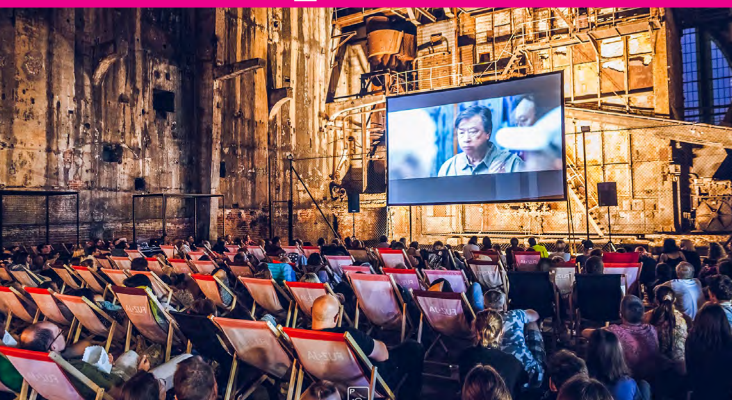
LETNI FESTIWAL FILMOWY TME POLÓWKA, FUNDACJA INICJATYW KULTURALNYCH PLASTER

Miejskie instytucje kultury w ramach prowadzonej działalności realizują szereg imprez, które wpisały się na stałe w kalendarz wydarzeń kulturalnych Miasta. Należą do nich między innymi: