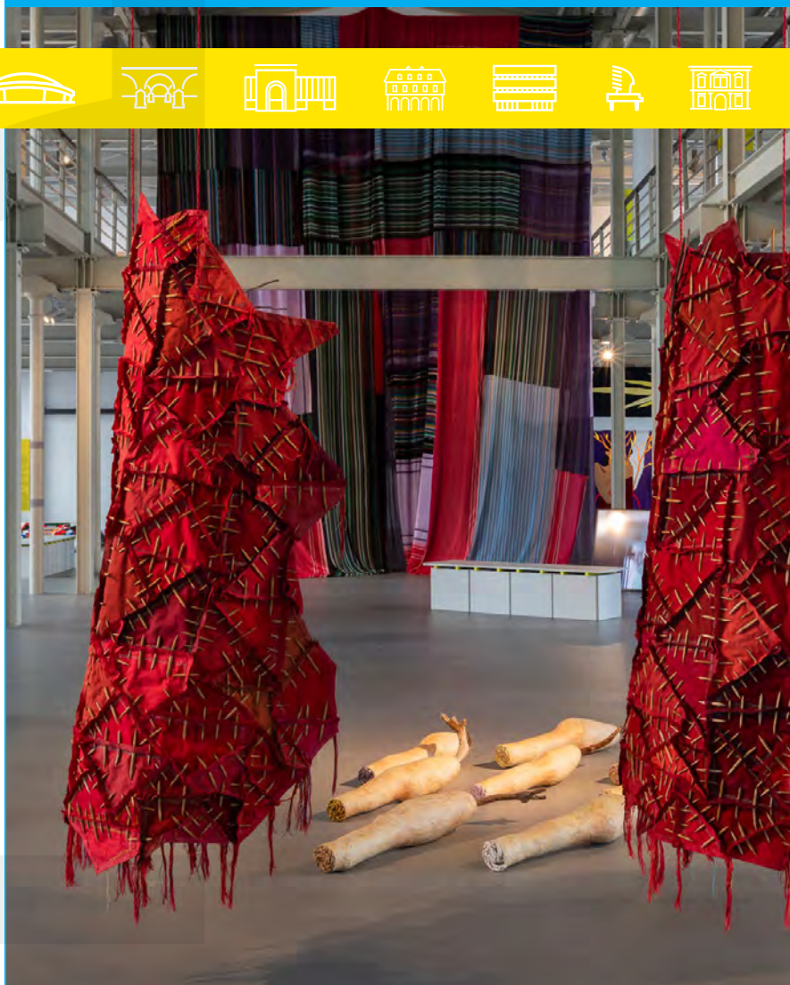
CENTRALNE MUZEUM WŁÓKIENICTWA

(Województwo Łódzkie i Minister Kultury i Dziedzictwa Narodowego), Teatr im. S. Jaracza w Łodzi (Województwo Łódzkie), Teatr Wielki w Łodzi (Województwo Łódzkie), Łódzki Dom Kultury w Łodzi (Województwo Łódzkie), Muzeum Dzieci Polskich - ofiar totalitaryzmu. Niemiecki nazistowski obóz dla polskich dzieci w Łodzi (1942-1945) (Minister Kultury i Dziedzictwa Narodowego), Muzeum Książki Artystycznej w Łodzi (Minister Kultury i Dziedzictwa Narodowego oraz Fundacja „Correspondance des Arts”).