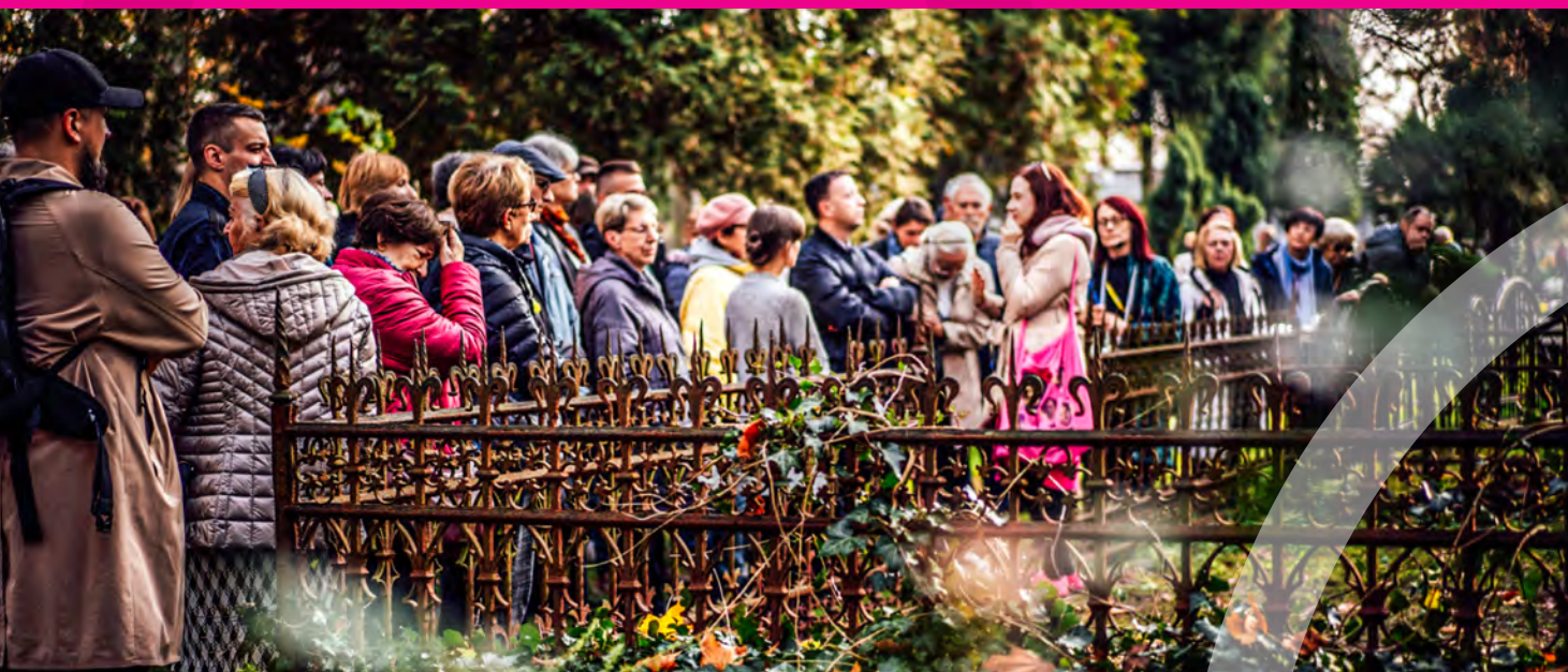
ŁODZIANKI. CZASOPRZESTRZEŃ, FUNDACJA ŁÓDZKI SZLAK KOBIET

O istotnej roli dialogu przekonują także doświadczenia płynące z okresu pandemii COVID-19, który dla sektora kultury wiązał się z wyjątkowymi trudnościami. Miasto w tym trudnym dla twórców okresie uruchomiło pakiet działań wspierających artystów, organizacje pozarządowe związane z kulturą oraz instytucje kultury. Program „Zdrowa kultura” był także wyrazem szacunku i podziękowania za dotychczasowe działania artystów w internecie na rzecz łodżan.